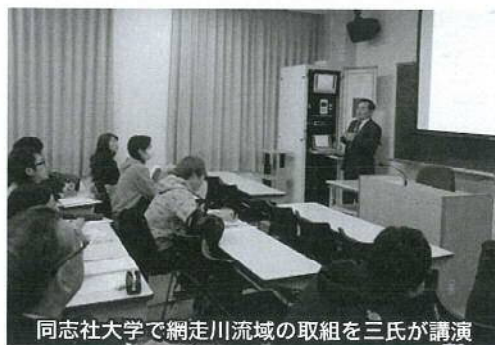
同志社大学で網走川流域の取組を三氏が講演