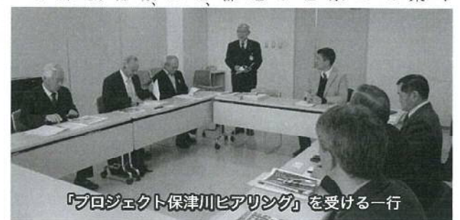
「プロジェクト保津川ヒアリング」を受ける一行

に大阪城や伏見城の築城に際しては、現在の京都市右京区京北町をはじめとした丹波山地の木材を都に運ぶなど、その流れば丹波と山城、摂津の木材輸送に重要な役割を果たしてきました。