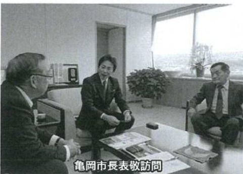
亀岡市長表敬訪問

た。網走流域の会はまだ始まったばかりですが今回の視察から得たことを今後の活動に生かしていきたいと思えます。なお、今回の視察については公益財団法人はまなす財団様の補助金(地域づくりステップアップ事業)を活用して実施しております。